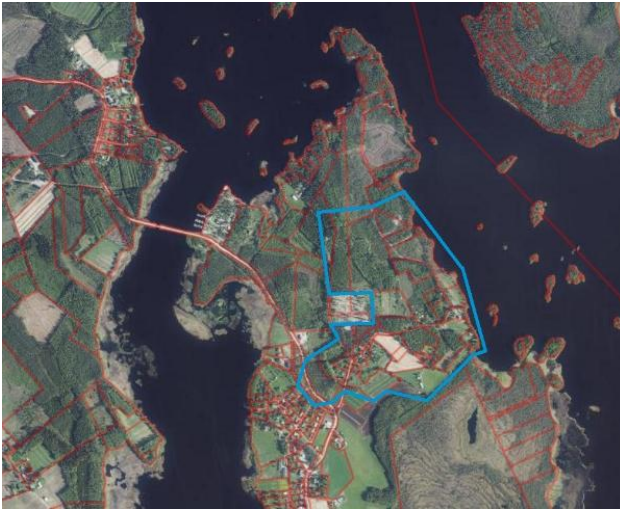
Kuva 1. Alustava kaava-alueen raja esitettyinä sinisellä viivalla.

Suunnittelualue sijaitsee Evijärven kunnassa noin 1,5 kilometrin päässä kunnan keskustasta pohjoiseen. Alue on kooltaan noin 55 hehtaaria.